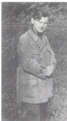
W parę miesięcy po śmierci Ojca przeszedłem z kamieniołomu do pracy w samej fabryce... Karol Wojtyła jako robotnik w czasie okupacji.

Spotykałem się na co dzień z ludźmi ciężkiej pracy, poznałem ich środowisko, ich rodziny, ich zainteresowania, ich ludzką wartość i godność. Osobiście doznałem od nich wiele życzliwości. Wiedzieli, że jestem studentem, i wiedzieli, że jeżeli tylko na to okoliczności pozwolą, wrócę do studiów. Nigdy jednak nie doznałem z tego powodu jakiegóż niezyczliwości. Nie drażniło ich to, że do pracy przynosiłem książki. Mówili: „My tu przypilnujemy, a pan niech sobie poczyta”.