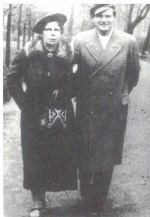
...młodość to czas rozpoznawania talentów. Student Uniwersytetu Jagiellońskiego z ciotką na Plantach w Krakowie.

W związku ze studiami pragnę podkreślić, że mój wybór polonistyki był umotywowany wyraźnym nastawieniem na studiowanie literatury. Jednakże już pierwszy rok studiów skierował moją uwagę w stronę języka. Studiowaliśmy gramatykę opisową współczesnej polszczyzny, z kolei gramatykę historyczną, ze szczególnym uwzględnieniem języka