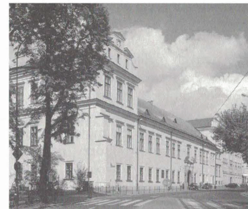
Przebywałem w tym szczególnym seminarium (...) począwszy od września 1944 roku... Pałac biskupi na ul. Franciszkańskiej 3, siedziba tajnego Krakowskiego Seminarium Duchownego.