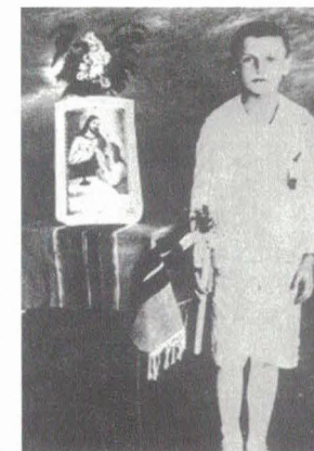
Pamiętam, że już jako dziecko nauczyłem się w domu rodzinnym modlić i ufać Bogu. Pierwsza Komunia Święta.

To wszystko przypomina mi moje życie: dzień Chrztu i dzień Pierwszej Komunii Świętej, z których nadal przechowuję fotografie. To są historyczne chwile w życiu każdego