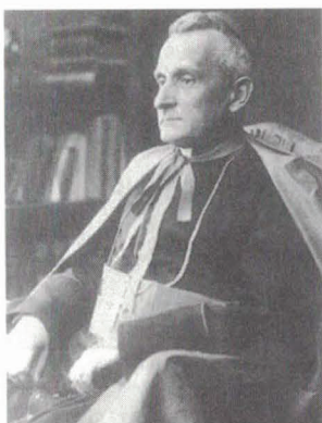
Ten człowiek był znakiem swego czasu (...) przez całe czterdzieści lat pasterzowania w Krakowie... Metropolita krakowski kardynał Adam Stefan Sapieha.

Ten człowiek był także znakiem swego czasu. Był nim przez całe czterdzieści lat pasterzowania w Krakowie;