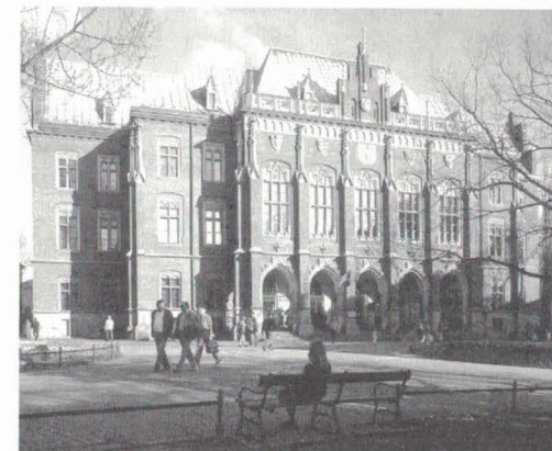
Uczelni Jagiellońskiej (...) zawdzięczam studia oraz pierwsze akademickie doświadczenia.

Pierwszy raz wszedłem w mury Collegium Maius jako dziesięcioletni uczeń szkoły podstawowej, aby uczestniczyć w promocji doktorskiej mojego starszego brata, absolwenta Wydziału Lekarskiego UJ. Do dzisiaj mam w oczach tę uro-