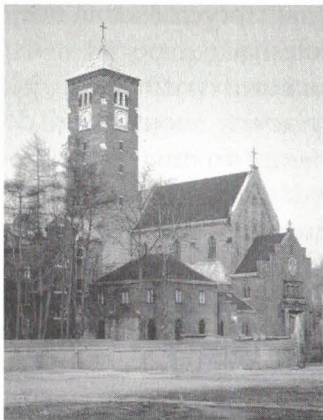
W pewnym okresie zastanawiałem się nawet, czy nie powinienem wstąpić do Karmelu. Kościół i klasztor karmelitów bosych w Krakowie, ul. Rakowicka 18.

W pewnym okresie zastanawiałem się nawet, czy nie powinienem wstąpić do Karmelu. Wątpliwości rozstrzygnął książę kardynał Sapieha w sposób sobie właściwy, mówiąc krótko: „Trzeba najpierw dokończyć to, co się zaczęło”. I tak się stało. 5 Tak więc nie otrzymałem wezwania do życia kontemplacyjnego, natomiast z najwcześniejszego okresu mojego nawrócenia na drogę życia wewnętrznego (i zarazem na drogę kapłaństwa), a także ze wszystkich następnym