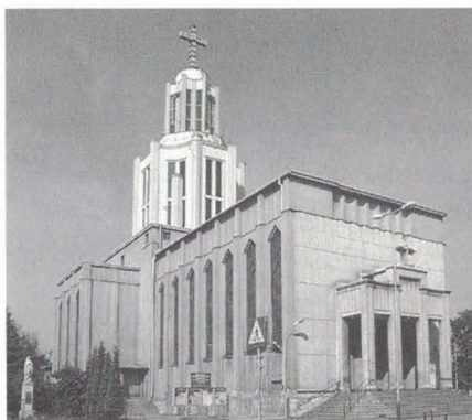
Parafia ta była prowadzona przez księży salezjanów, których pewnego dnia hitlerowcy zabrali do obozu koncentracyjnego. Kościół św. Stanisława Kostki na Dębnikach w Krakowie.

Wracając jeszcze do okresu przed pójściem do seminarium, nie mogę pominąć jednego środowiska i jednej postaci, która