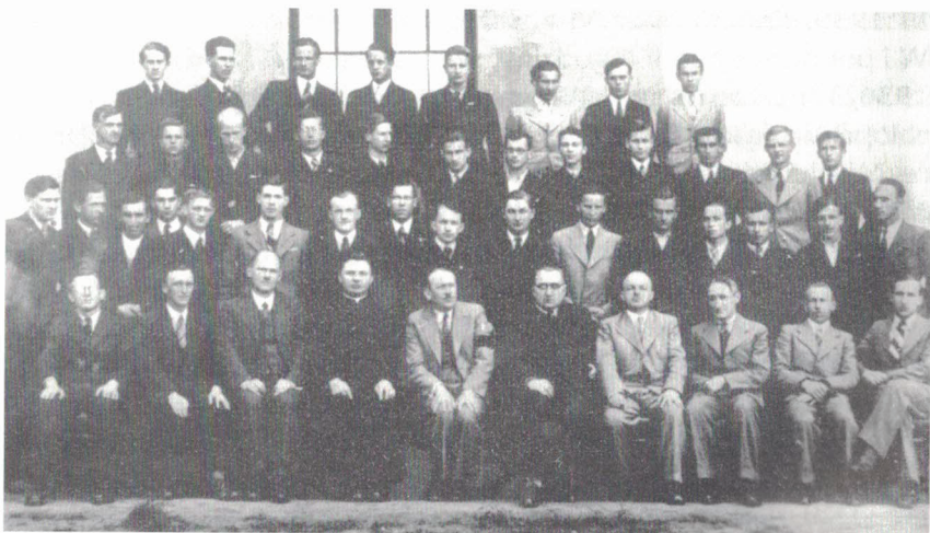
Rocznik 1938 z Karolem Wojtyłą (pierwszy z lewej wśród stojących)