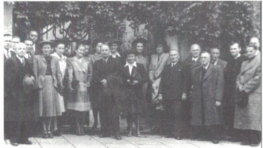
Pierwszy zjazd rocznika 1938 w Wadowicach - w 10-lecie matury

10 XI 1946: Prymicyjna Msza św. w kościele Ofiarowania NMP w Wadowicach. Zapowiedziana uroczysta Msza św. prymicyjna wyświęconego w uroczystość Wszystkich Świętych na kapłana ks. Karola Wojtyły odbędzie się, o ile Pan Bóg dozwoli, w tutejszym kościele w przyszłą niedzielę. Wprowadzenie uroczyste Prymicjanta